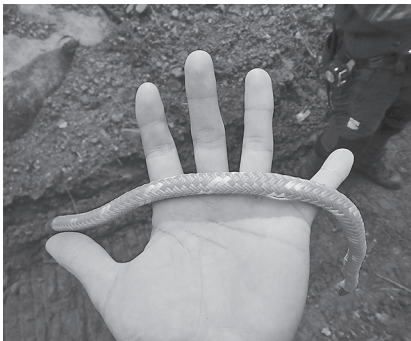
軽量で柔らかい素材です

今後は、この繊維ロープの導入を通じて、作業員の労働負担の軽減を図るとともに、作業効率を上げ、更なる森林整備の促進を図って行くと共に、労働安全性の向上も期待しています。