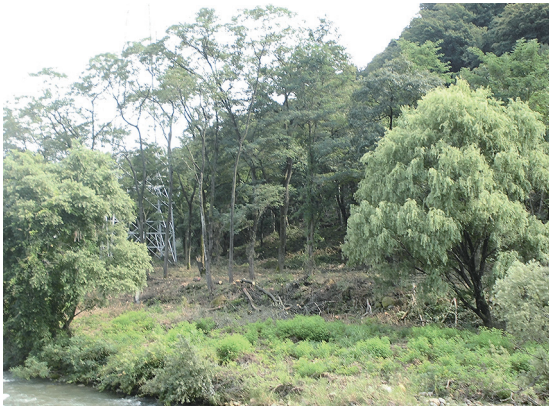
見通しが良く明るくなった現場

高齢化や人口減少により里山の整備を地域で行う事が難しい状況もありますが、この様な里山の整備を行う事によって「人間と獣の住む領域が区別され、獣も出にくくなると思われまます」ので、定期的に作業を行う必要性を感じました。