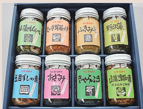
きのこと山菜8本セット

今年も11月20日より、鬼無里事業所食品加工工場で製造している「きのこと山菜の加工品詰合せ」の「ギフトフェア」を開催致します。お歳暮などの贈答用にお薦めする「ご飯大好きセット」(6本詰合せ)や「きのこと山菜8本セット」をはじめ、お使い用にも便利な「3本詰合せセット」も12月下旬までの期間限定で、特別価格にて御用意しております。