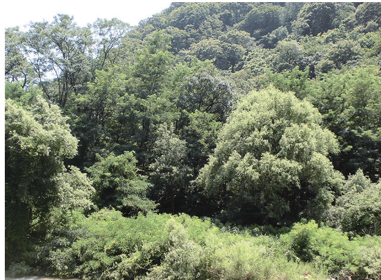
うつそうとした作業前の現場