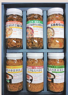
ご飯大好きセット

各詰合せセットは、事前にご注文いただきましたことと、後日、お近くの支所で品物をお渡しすることも出来ます。ご注文お問い合せは、鬼無里事業所(TEL:026-125612233)、又は、お近くの各支所、本所までお願い致します。