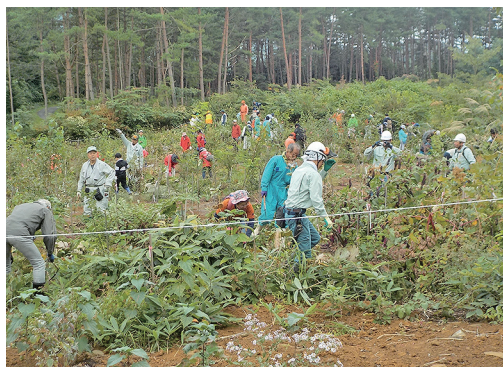
下草刈り作業の様子

その後の木工教室では椅子作りを行いました。説明書を睨みながら部品を一個づつ組み立てている子供た