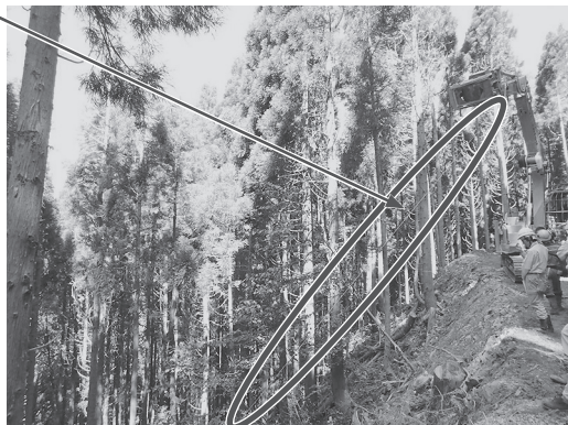
スギ間伐材を下方から作業場まで集材試験中