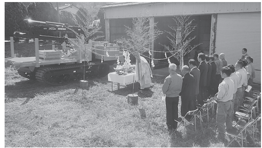
フォワーダの入魂式(須高支所)

を導入し所有台数25台となりました。9月26日(木)に、長野地域振興局、須坂市、小布施町、高山村の代表の方々にもご出席いただき、フォワーダの入魂式を執り行いました。導入した各機材を有効に活用し、役職員一同安全作業で事業を推進してまいります。