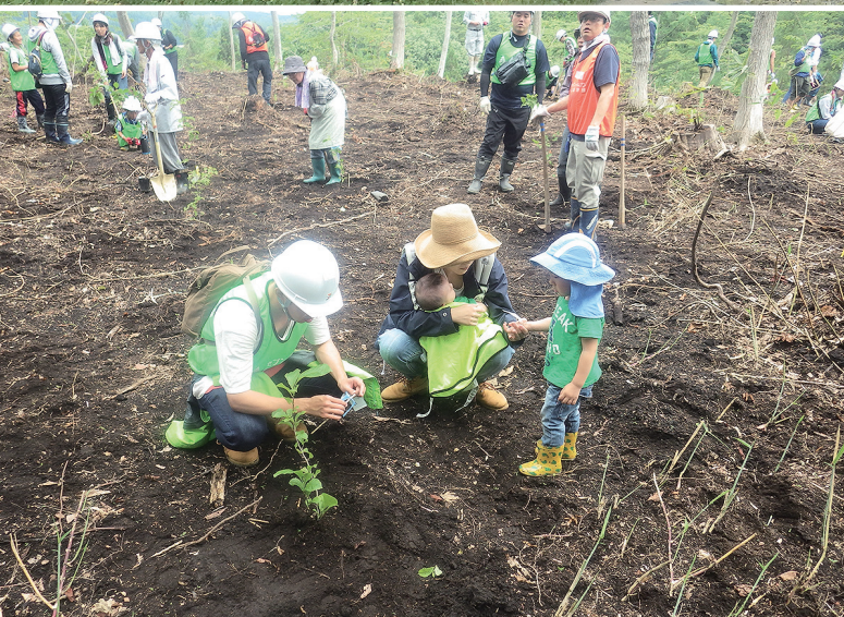
家族でコブシを植樹

第4回長野セブンの森活動〔信濃町 やすらぎの森 (写真後方は妙高山)〕 (関連記事 P3)