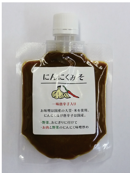
スパウトパウチ容器入の「にんにくみそ」

に塗ったり、肉や野菜と一緒に炒めたり、野菜にそのままつけて食べてもおいしくいただけます。現在、「にんにくみそ」は、主に首都圏の生活クラブ生活協同組合を中心に販売を行っておりますが、地域の農産物直売所や小売店様など一部の店舗様にも取扱って頂いております。徐々に取扱店を広げていく予定です。