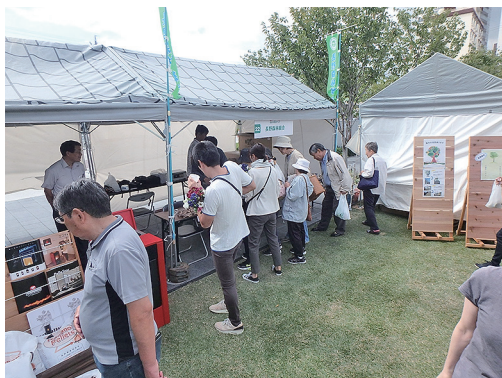
大勢のお客様に来場頂きました

10月5日(土)、長野市役所の桜スクエアで『2019長野市農業フェア』が開催され、長野支所も出店しました。今まで農業フェアは、産業フェアと同時に開催されてい