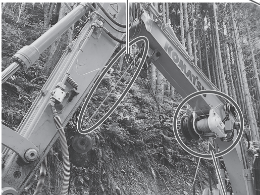
グラップルのウインチに装着