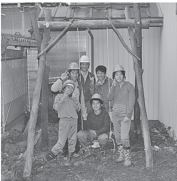
手作りのブランコが完成しました

子供たちは、「ゆがみの調整に大変苦労しました」が、全員で協力し一つものを作り上げたことの達成感が大きく、早速ブランコに代わる代わる乗って安全かどうか確認していました。