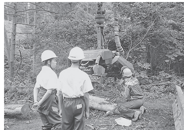
ハーベスタヘッドのメンテナンスを見学