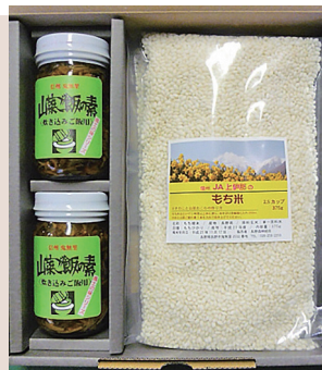
きのこと山菜おこわセット

今年も11月20日より、鬼無里事業所食品加工工場で製造している「きのこと山菜の加工品詰合せ」の「ギフトフェア」を開催致します。お歳暮などの贈答用にお薦めする「ご飯大好きセット」(6本詰合せ)や「きのこと山菜8本セット」をはじめ、お使い用にも便利な「3本詰合せセット」も12月下旬までの期間限定で、特別価格にて御用意しております。