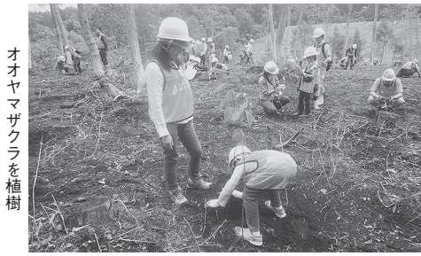
オオヤマザクラを植樹

森」の第4回目の活動を信濃町「やすらぎの森」で行いました。当日はセブン・イレブン・ジャパンの社員の方々や近隣の加盟店オーナーの方々やその家族、