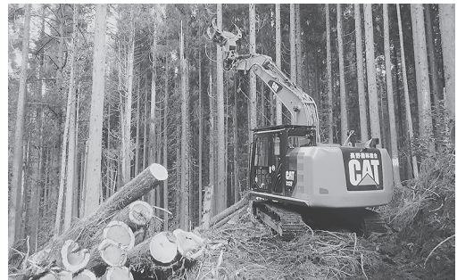
スイングヤーダでスギ材を集材(北部支所)