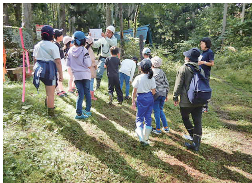
森のアドベンチャーゲームの様子