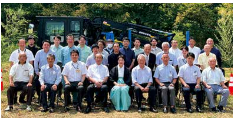
入魂式の集合写真