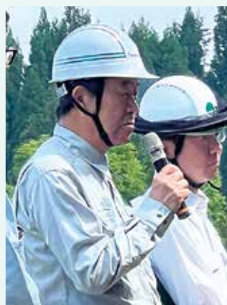
あいさつをする和田組合長と北信森林管理署 林署長

昨年(図2)から(株)小松製作所の全面的なご協力をいただく中進めてきた工法で、今年はコマツの土木用ICT技術である「マシンガイダンス」を活用し、草に覆われて苗木が全く見えない現場(図2)でも誤伐することなく下刈りを行うことについて実証を行いました。