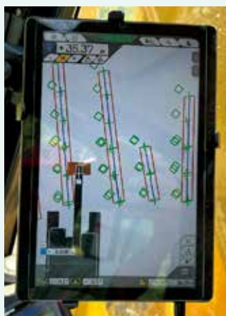
(図3) 重機内のタブレットに苗木位置とヘッドの位置がリアルタイムに表示される

結果的に1本も誤伐することなく下刈りを完了することができ、マシンガイダンス技術が林業分野でも極めて有効であることが実証されました。