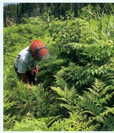
(図2) スギの苗木が見えない作業前の状況