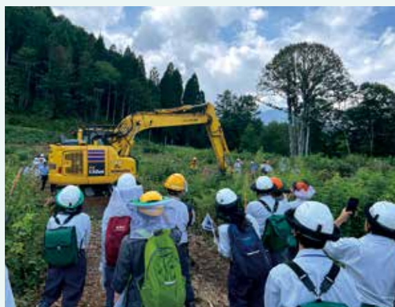
下刈りを行うコマツPC138US マシンガイダンス搭載機