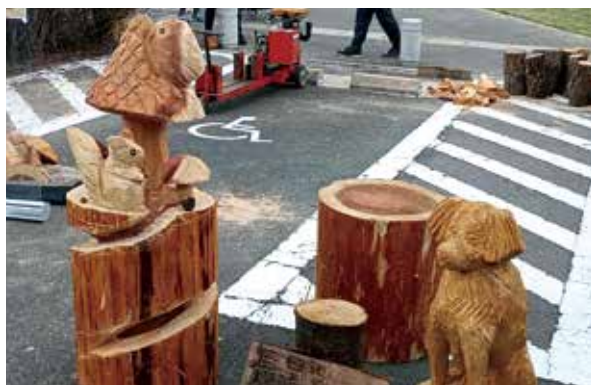
完成したチェーンソーアート作品