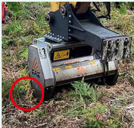
(図1) 地拵え(下刈り)まで行うマルチャーマシンガイダンスにより草に覆われて見えない状況でも苗木のギリギリ際までコントリールが可能

令和7年8月26日(火)に、上水内郡信濃町霊仙寺山国有林において、中部森林管理局北信森林管理署と長野森林組合の共催で、マルチャー(図1)を装着したバックホウによる下刈り作業の現地検討会を84名の参加者の下行いしました。