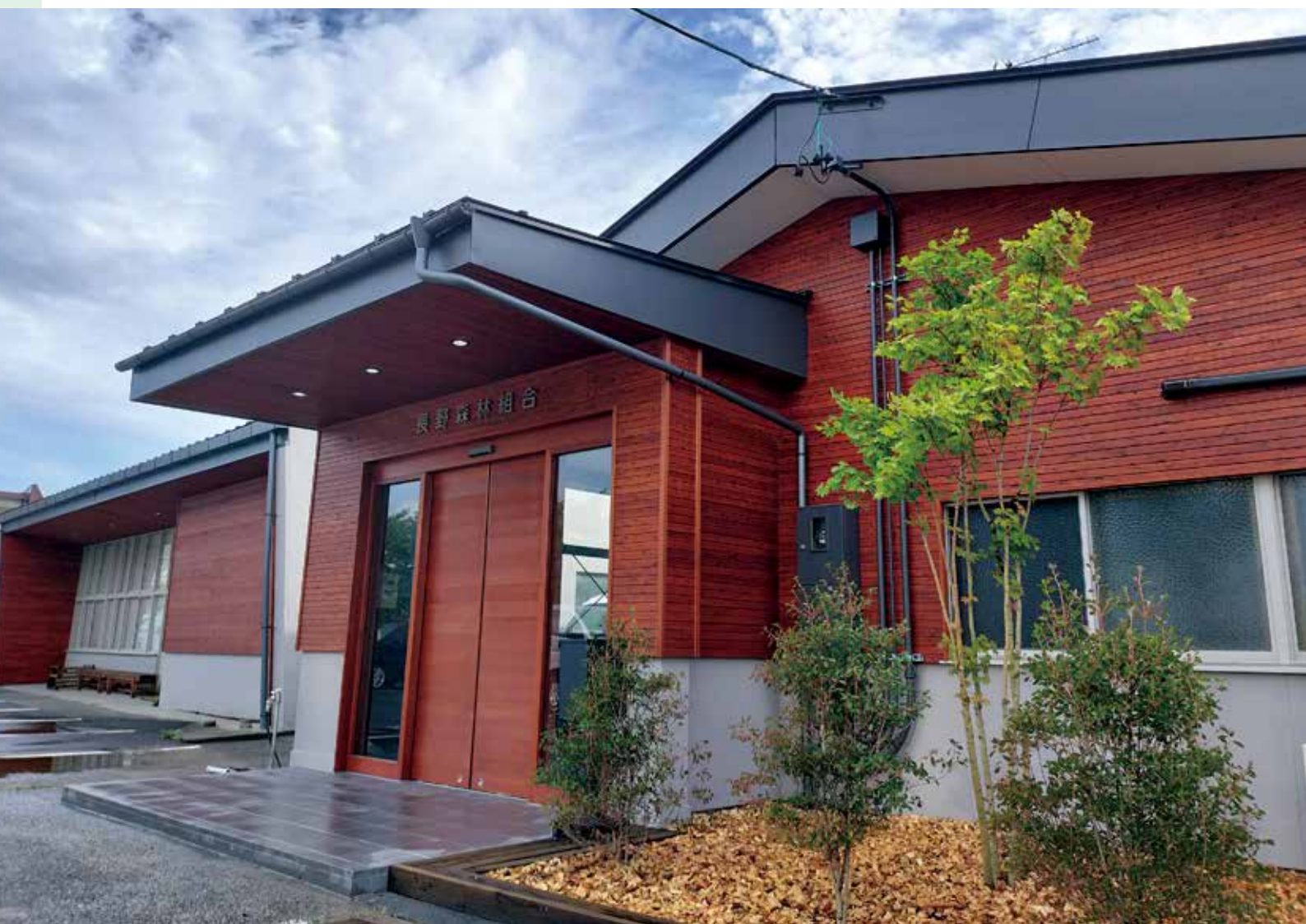
本所の事務所改修工事(関連記事 P5)