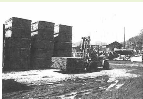
フローリング生産の全盛期