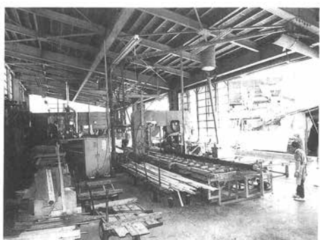
55年 小径木処理施設