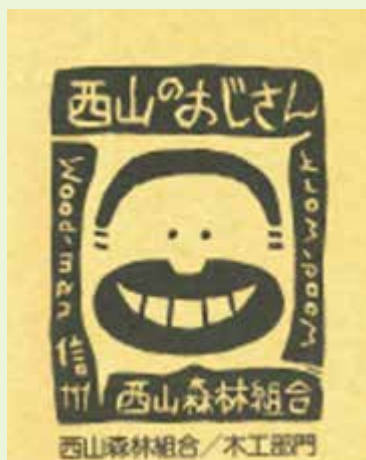
木工品の包装紙に利用した絵柄