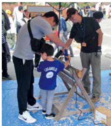
親子でこの駒打ち体験