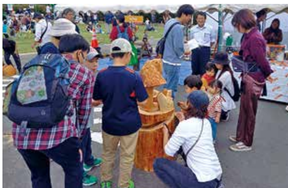
チェーンソーアート作品に触れている子供たち