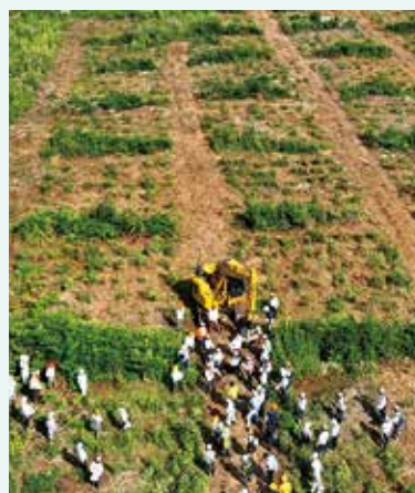
現地状況 (UAV (ドローン) からの映像)

今後も機械メーカーや各方面の有識者と連携し、労働安全性の向上と、労働負荷の低減に向けた研究開発を進め、魅力ある林業の実現に向け挑戦してまいります。