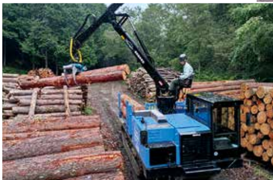
作業中のフォワーダ

15年(稼働時間11065時間)と長年にわたり木材の運搬等に活躍してきました。これからこの新しいフォワーダも大切に使用し、地域の木材生産・森林整備等の促進に活躍させていきたいと思います。